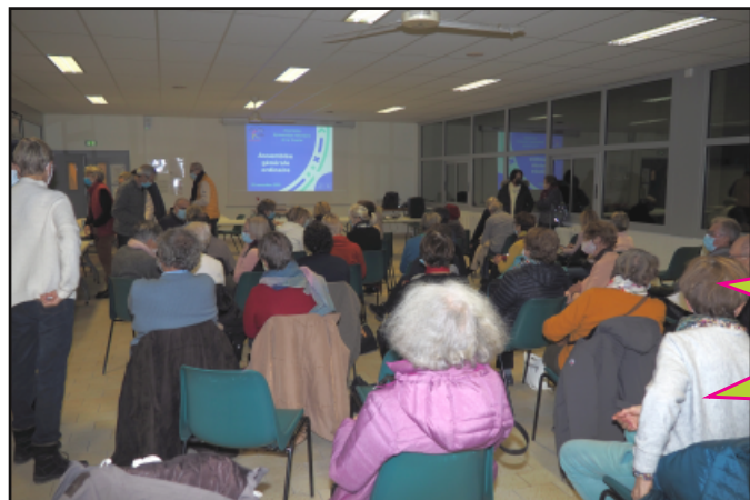
L'Assemblée Générale 2020-2021.

En ce début 2022, nous sommes 239 licenciés.