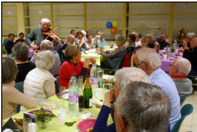
Repas des randonneurs 2019.

Prévu le 29 janvier, le repas n'a pas pu se faire, vu les contraintes sanitaires. Ce n'est que partie remise !