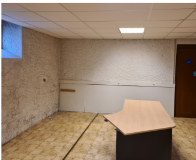
On peut attaquer !