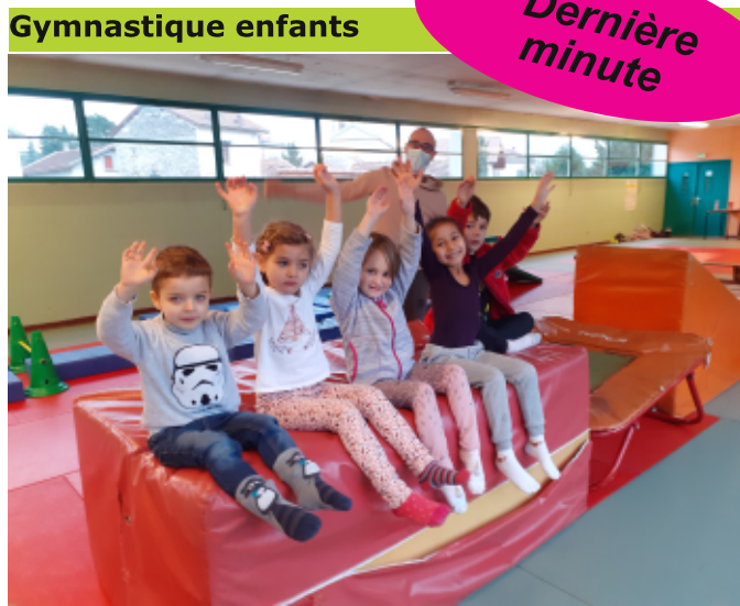
Voyez comme ils sont heureux de se retrouver et de reprendre les cours !