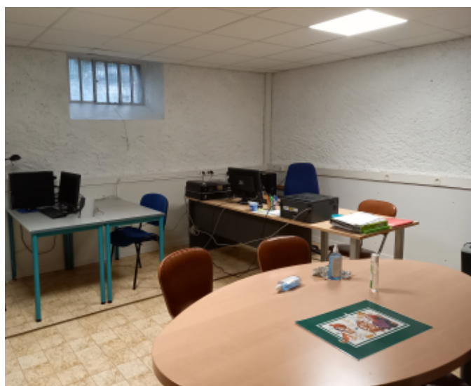
Et voici le résultat.