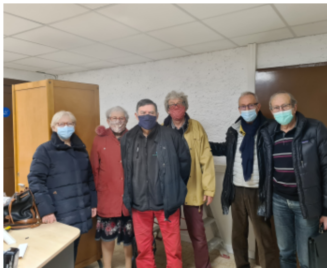
Réunion de chantier.