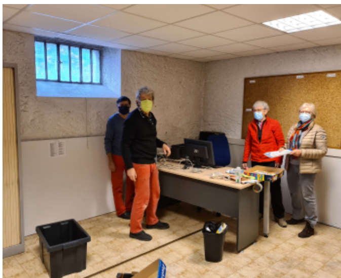
Déménagement avant travaux.