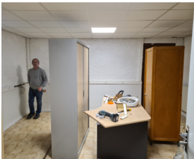
Attention travaux en cours...